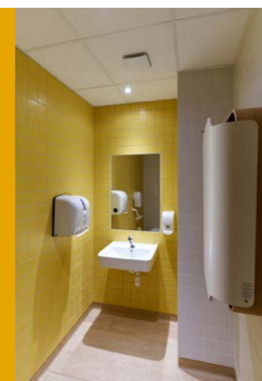
Salle de bain avec table à langer