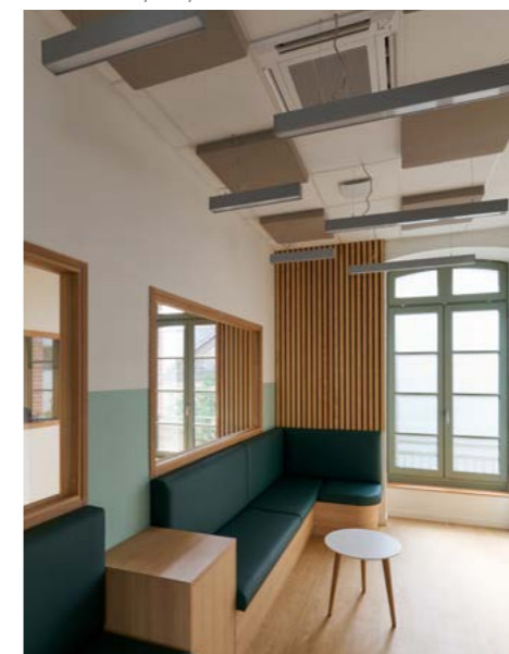
Salle d'attente à l'étage