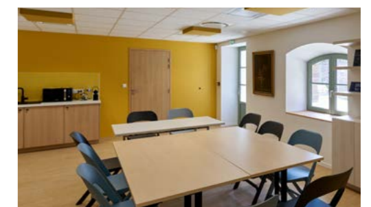
Salle de formation