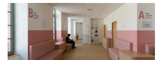
Salle d'attente à l'étage