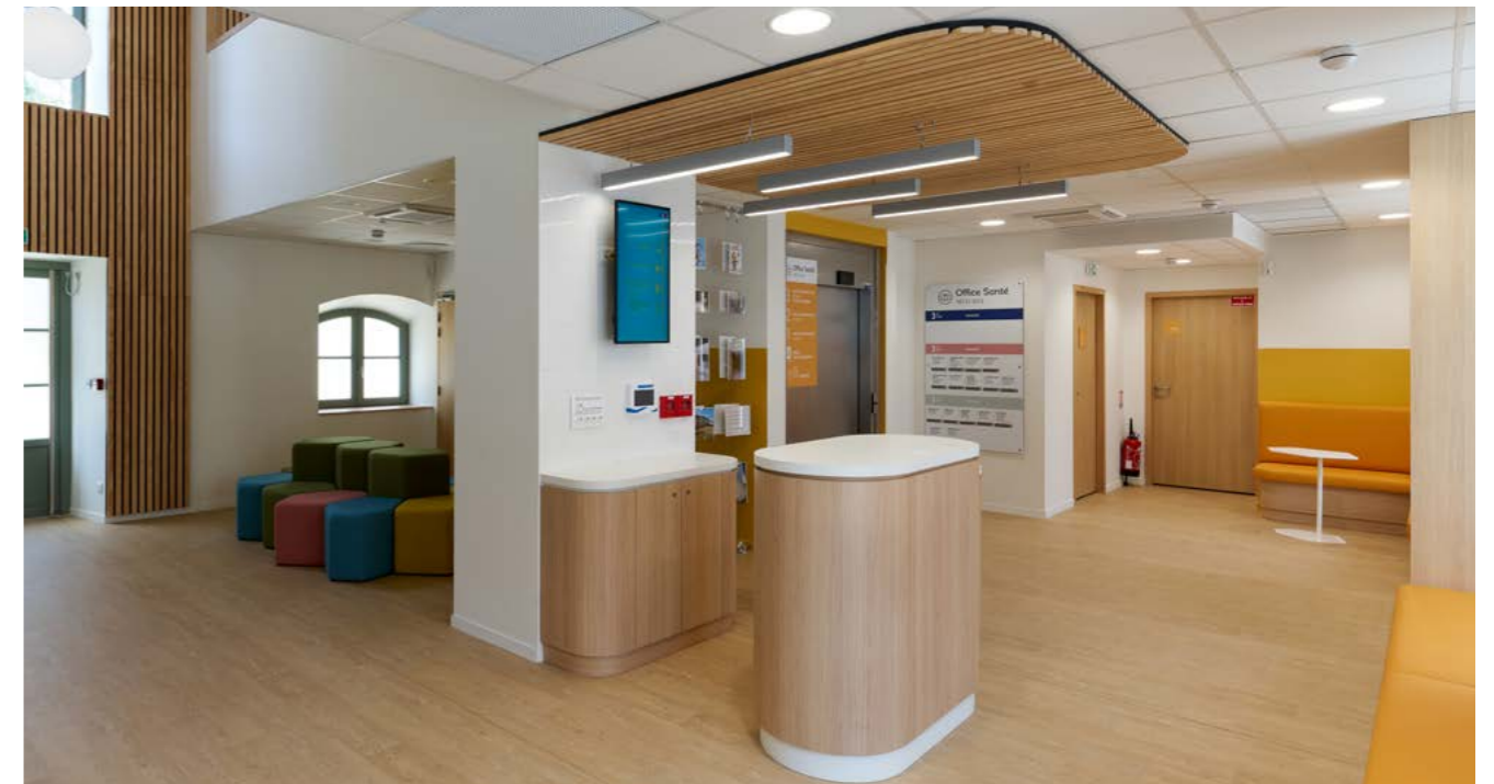
Accueil du hall principal