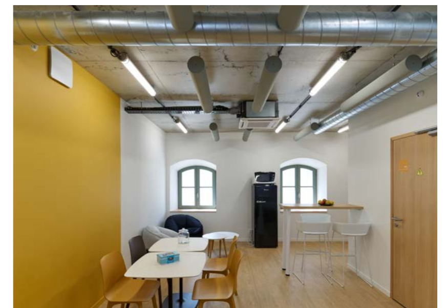
Salle du personnel