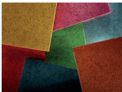
© Knauf Organic sera disponible à partir d'octobre 2011

Frédérique Vergne | 20/06/2011 | 18:09 | Innovation produits